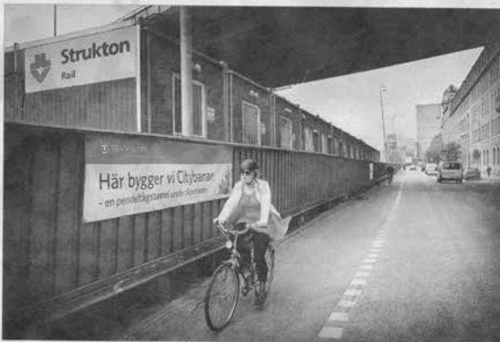
Vid Torsgatan under Banhusbron ligger Vasastans påfart till arbetstunneln. Härifrån skulle man kunna cykla till Solna eller Södermalm på fem minuter.

– Det vi undersöker är framför allt någon form av arbetspendling, främst morgon- och eftermiddag. Närertid måste tunneln